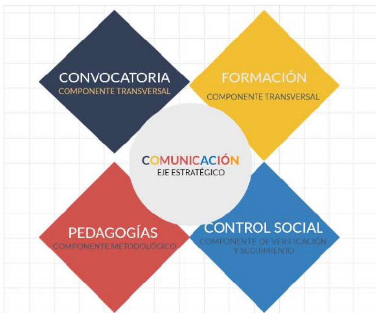
Gráfica 1. Componentes de la estrategia de participación co-creada

La estrategia de participación co-creada con diferentes actores territoriales, en cinco talleres de trabajo colaborativo, se consolidó alrededor de cinco componentes, siendo la comunicación el eje estratégico del proceso, el cual se propuso ser alimentado y/o complementado por dos componentes transversales, siendo estos convocatoria y formación , un componente metodológico denominado pedagogías y un componente final de verificación y seguimiento, al que se le dio el nombre de control social .